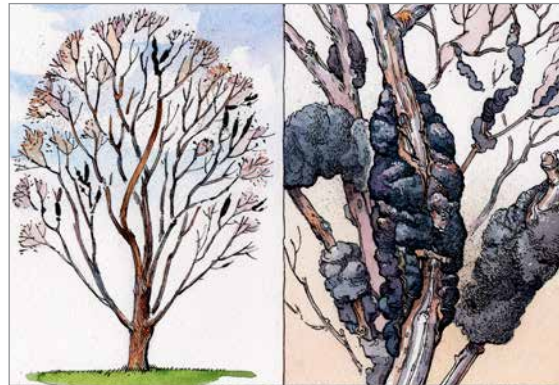
فطر العقدة الأسود