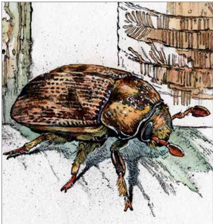
خنفساء لحاء شجرة المران

تذكر أن: أسهل طريقة للمساعدة في منع وعلاج الآفات والأمراض هو الحفاظ على أشجارك في حالة صحية: توفر الري، والغطاء العضوي، والتشذيب عند الحاجة، في حالة عدم التأكد من توفر المعلومات اللازمة، يُرجى التواصل مع متخصص.