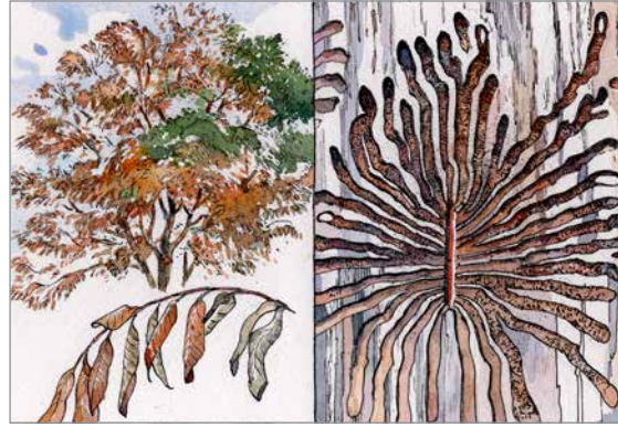
مرض الدرادر الهولندي