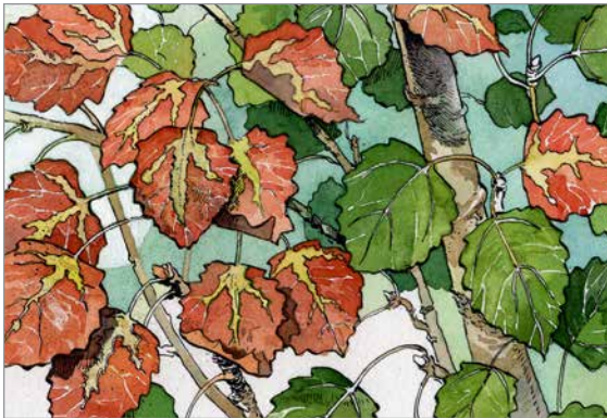
مرض تحول الأوراق للون البرونزي