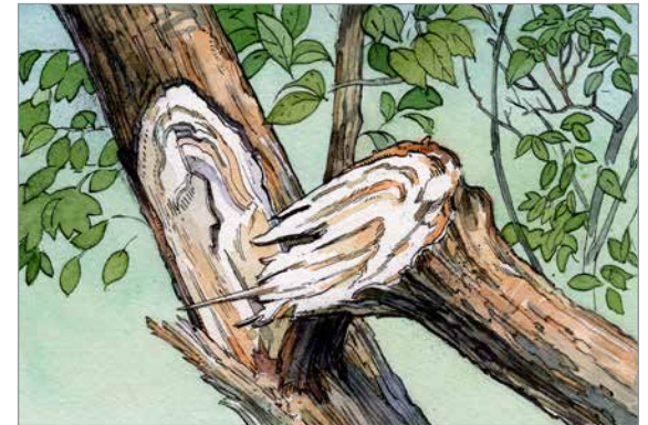
الفروع المكسورة في الأشجار النفضية

يتسم طقس مدينة كالغاري بالعواصف الثلجية، والرياح القوية، والعواصف الرعدية الشديدة المصحوبة بضربات البرق والصقيع على مدار العام. اتبع الخطوات التالية بعد هبوب العاصفة لفحص أشجارك ومساعدتها على التعافي.