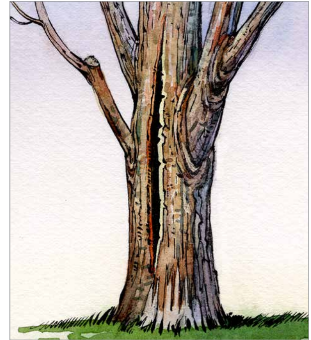
جذع الأشجار النفضية المتصدع

يمكن أن تصبح الأشجار المجهدة عرضة لآفات. تشمل عوامل إجهاد الأشجار على الجفاف، الفروع المكسورة، والشقوق في الجذع، وتعرض الجذور للكثير من المياه. ويمكن السيطرة على الأمر بمعرفتك لما تبحث عنه والتصرف المناسب.