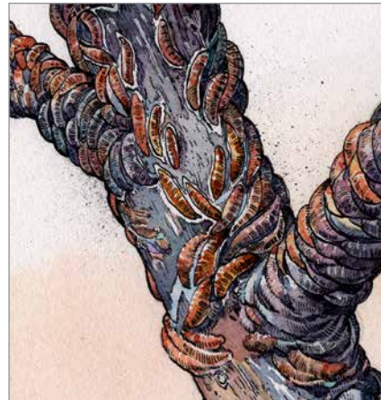
الحشرة القشرية المحارية الشكل