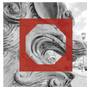
D. 住屋、健康、社會意義